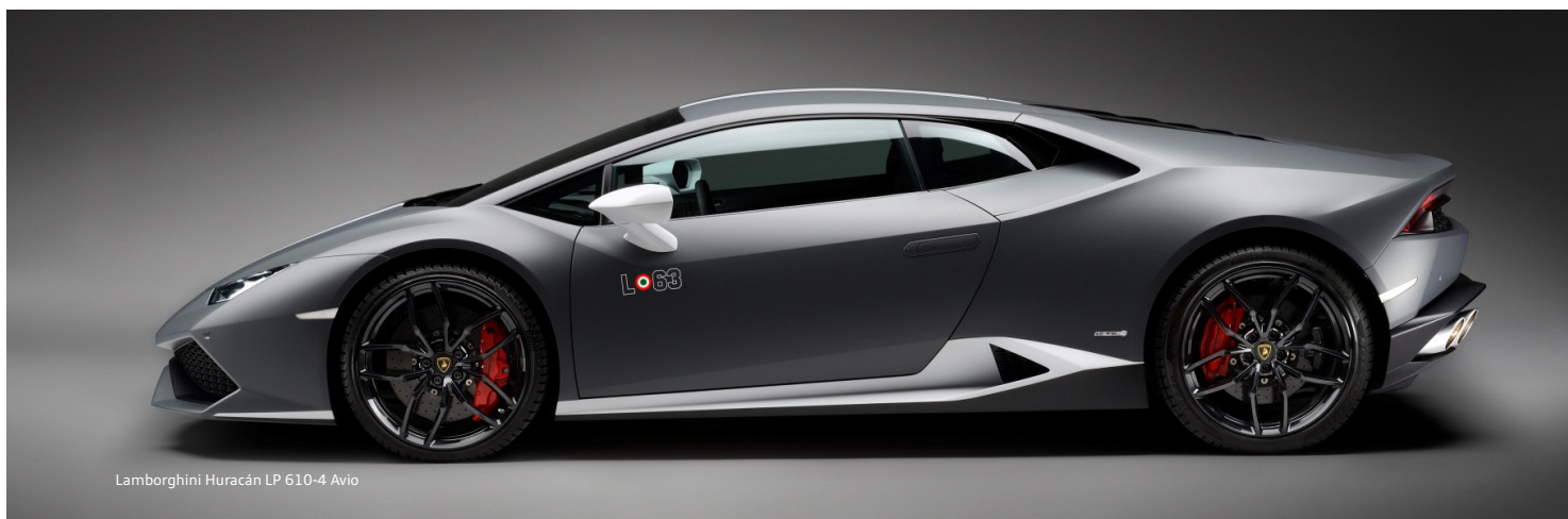
Lamborghini Huracán LP 610-4 Avio

Der Zwischenlagebericht enthält zukunftsbezogene Aussagen über erwartete Entwicklungen. Diese Aussagen basieren auf aktuellen Einschätzungen und sind naturgemäß mit Risiken und Unsicherheiten behaftet. Die tatsächlich eintretenden Ereignisse können von den hier formulierten Aussagen abweichen.