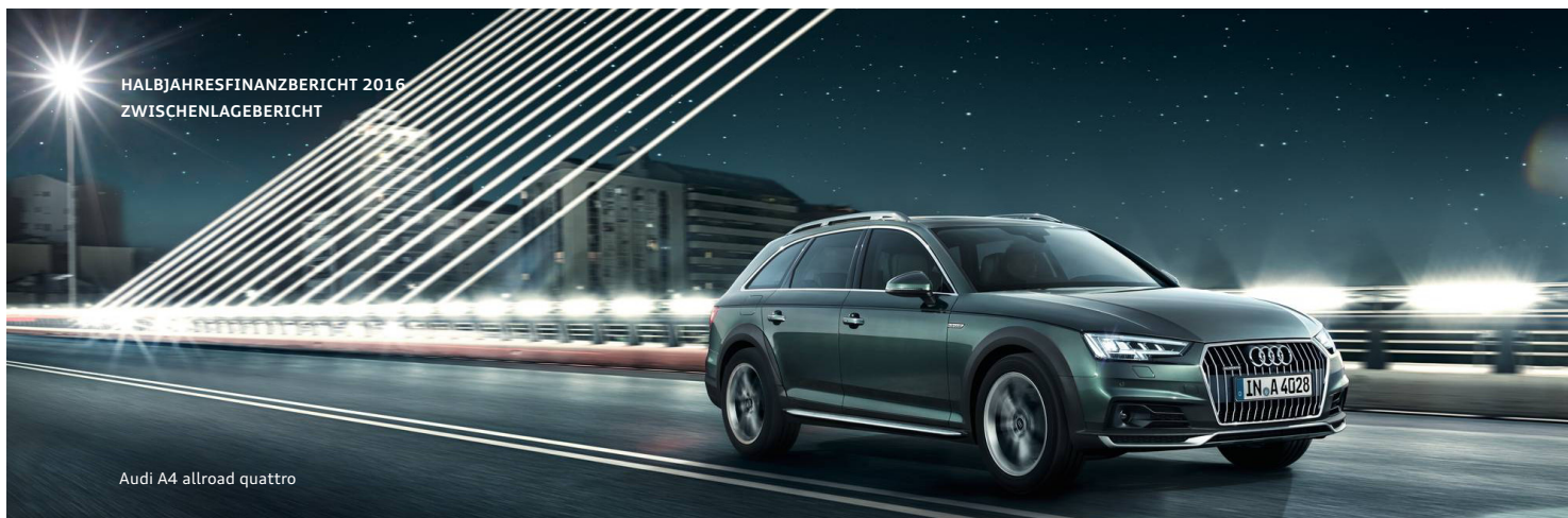
Audi A4 allroad quattro