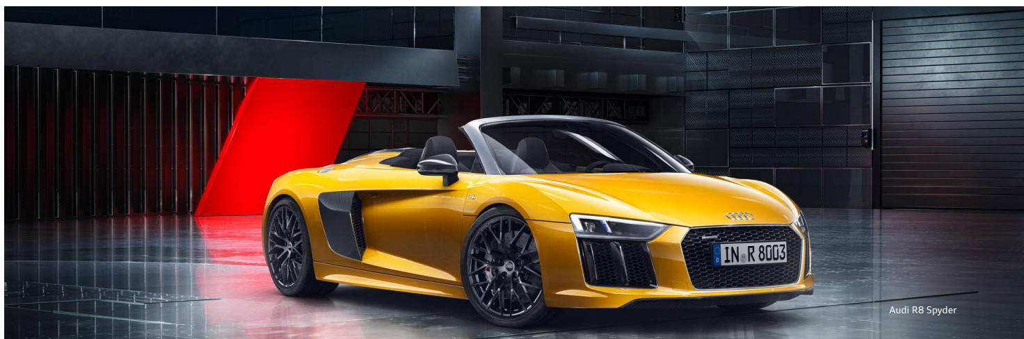
Audi R8 Spyder

Die Werte für Kraftstoffverbrauch und CO 2 -Emissionen sowie die Effizienzklassen finden Sie auf Seite 18.