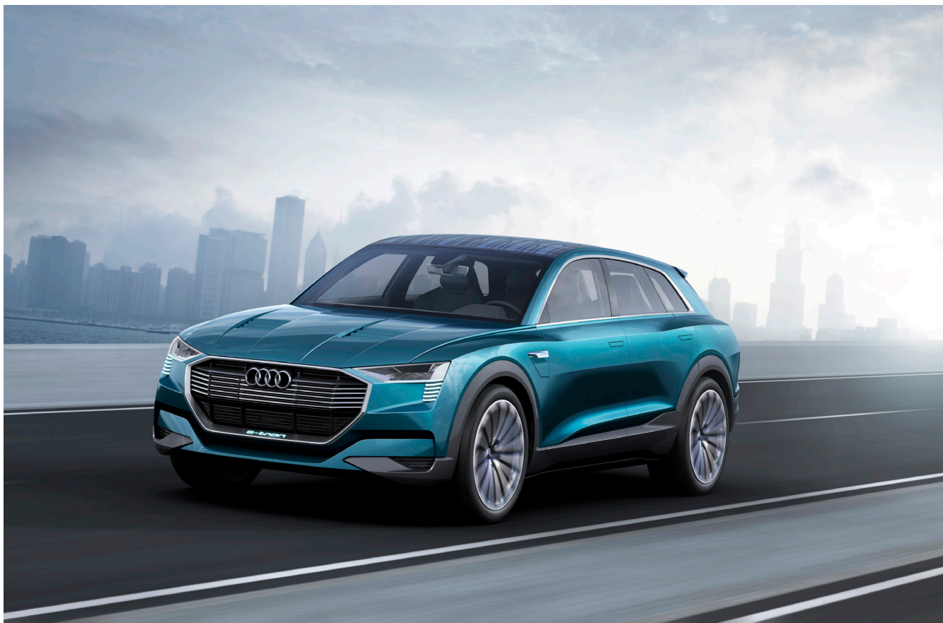
Die Studie Audi e-tron quattro concept gibt einen Ausblick auf unsere erste Großserienfertigung eines rein elektrisch angetriebenen SUV.

zu bleiben. Mobilität ist auch dort ein Grundbedürfnis. Deshalb setzen wir unsere Technologien zielgerichtet für innovative urbane Lösungen ein. Die Stadt ist das komplexeste Testfeld für unsere Technologien. Dort sind Raum, Zeit und andere Ressourcen wie saubere Luft knapp. Und doch soll individuelle Mobilität weiterhin ihre Berechtigung haben. Unser pilotiertes Parken ermöglicht platzsparende Parkhausplanung. Ein mit Ampeln vernetzter Audi optimiert den Verkehrsfluss. Und eines Tages eröffnen selbstfahrende Systeme den Bewohnern von Smart Cities neue Formen der intermodalen Mobilität.