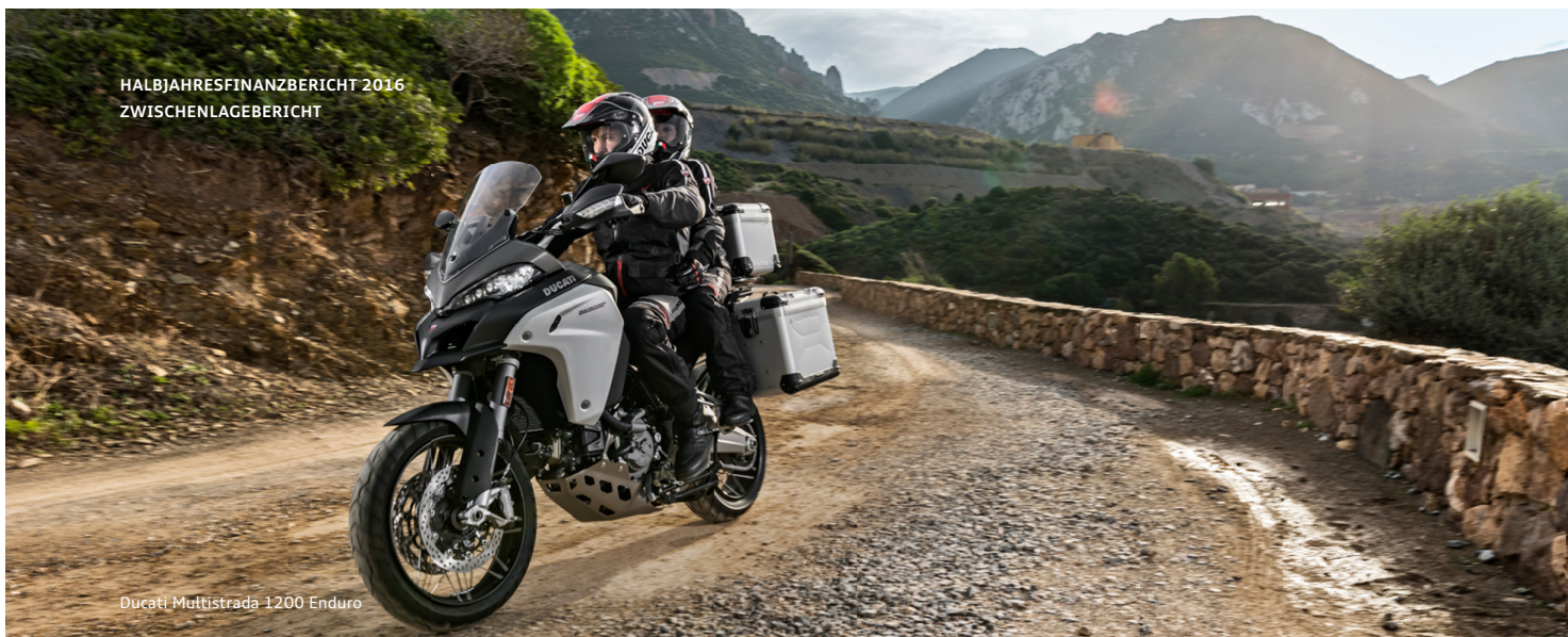
Ducati Multistrada 1200 Enduro