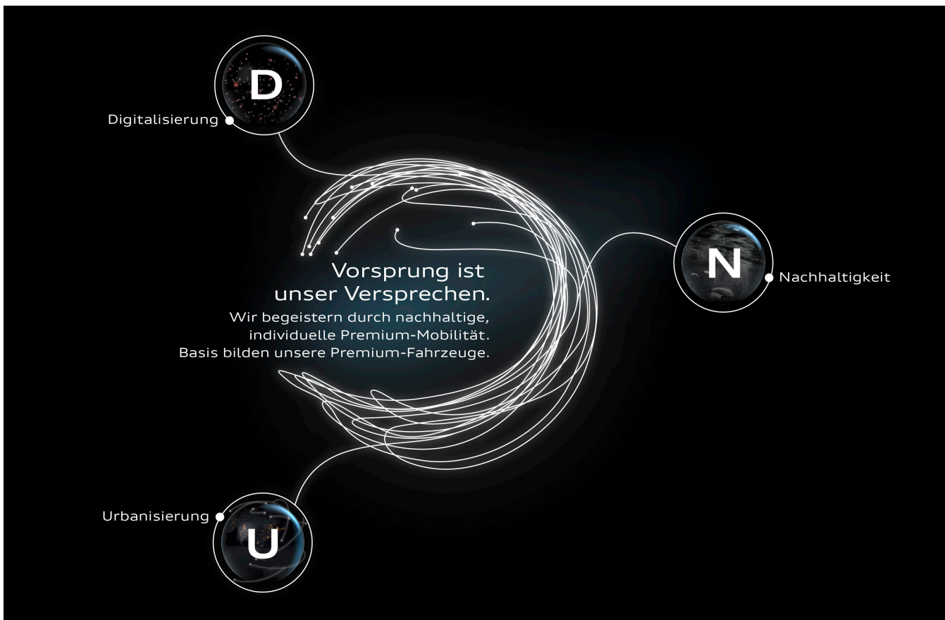
Vision und Fokusfelder der neuen Strategie 2025

Die Mehrheit der Menschen lebt heute in Städten. Die Herausforderung für die Stadt der Zukunft besteht darin, lebenswert