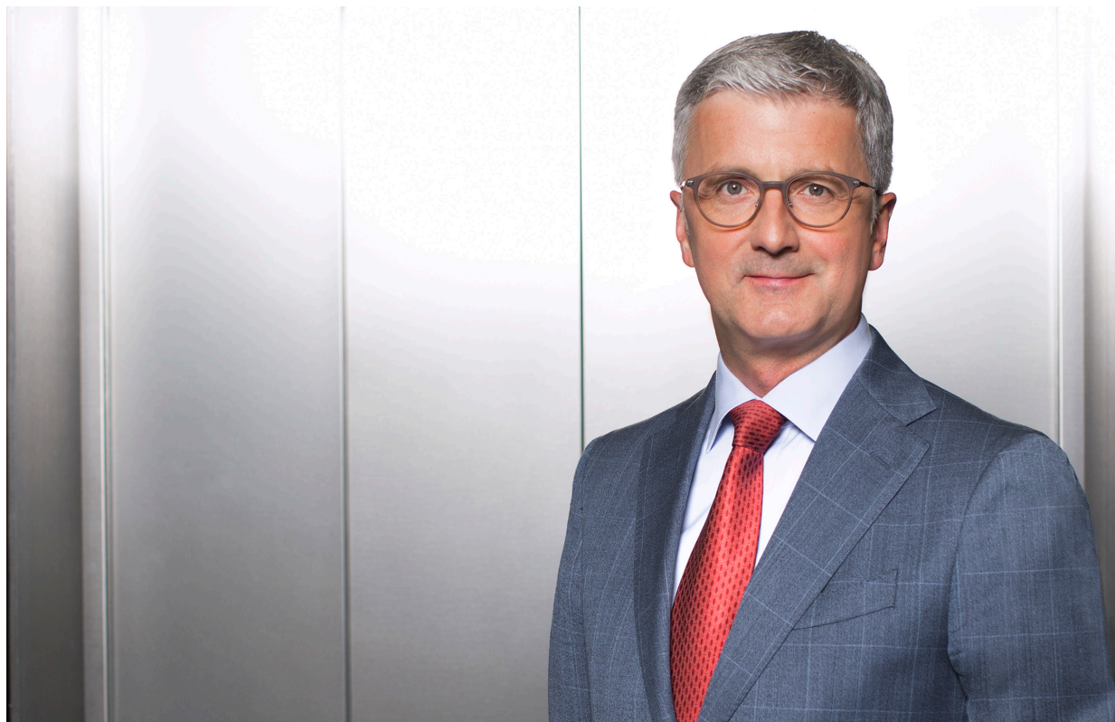
Prof. Rupert Stadler Vorsitzender des Vorstands der AUDI AG

Liebe Aktionärinnen und Aktionäre Liebe Leserinnen und Leser,