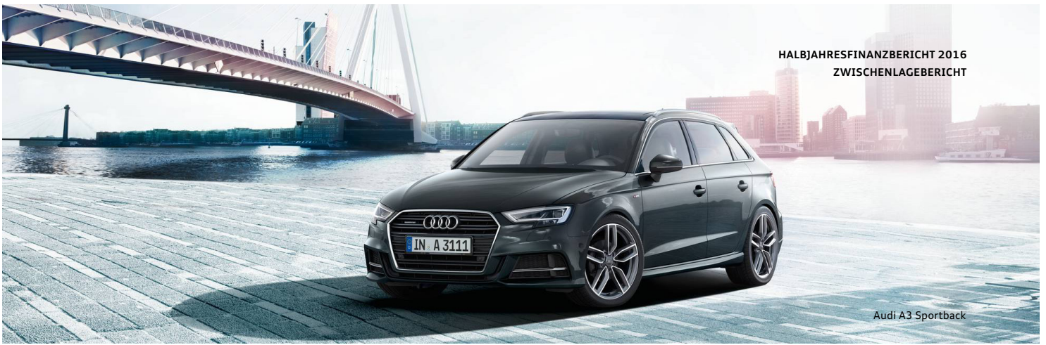
Audi A3 Sportback

positiv. Demgegenüber belasteten neben den Sondereinflüssen negative Währungseffekte und die hohe Wettbewerbsintensität das Operative Ergebnis. Zudem spiegelt sich der Ausbau unseres Modell- und Technologieportfolios sowie unserer internationalen Fertigungsstrukturen in höheren Abschreibungen wider. Im Segment Motorräder steigerten wir das Operative Ergebnis insbesondere infolge des Volumenwachstums auf 58 (46) Mio. EUR und erzielten so eine Operative Umsatzrendite von 11,9 (10,5) Prozent. Bereinigt um die mit der Kaufpreisallokation verbundenen Effekte erreichten wir im Segment Motorräder ein Operatives Ergebnis von 70 (58) Mio. EUR und eine Operative Umsatzrendite von 14,3 (13,2) Prozent.